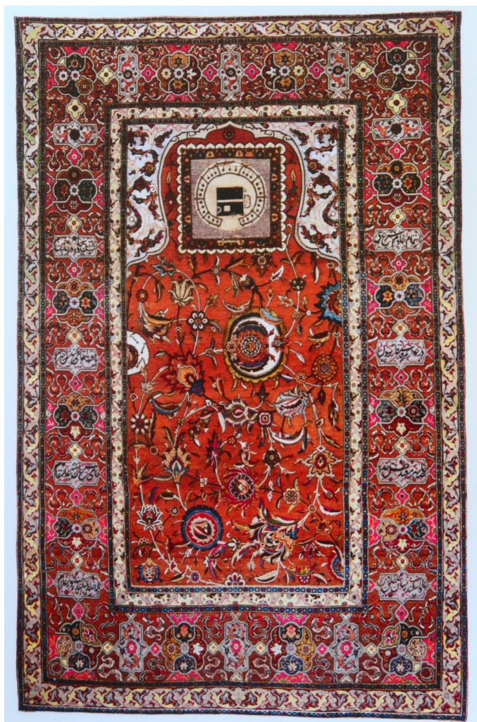
Tapis du centre de l'Iran , fin du XVIe siècle à chaîne de soie et des broderies métalliques 111 x 175 cm. Provenance du musée Mevlana de Konya