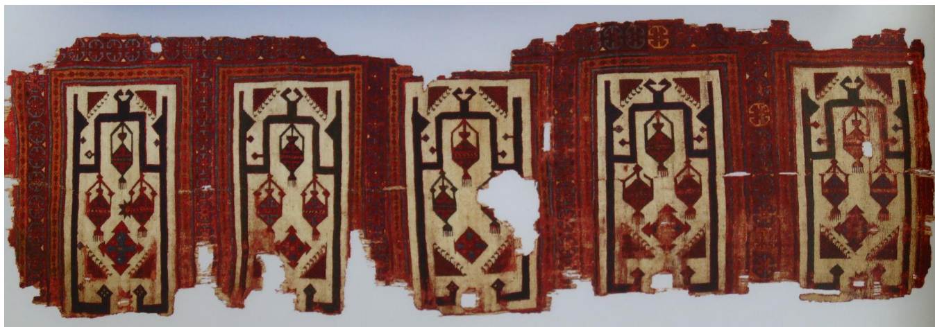
Tapis de prière à multiple niches de Konya (Turquie) en provenance du Musée des Arts Turcs et Islamiques d'Istanbul

Autres tapis très rarement accessibles :