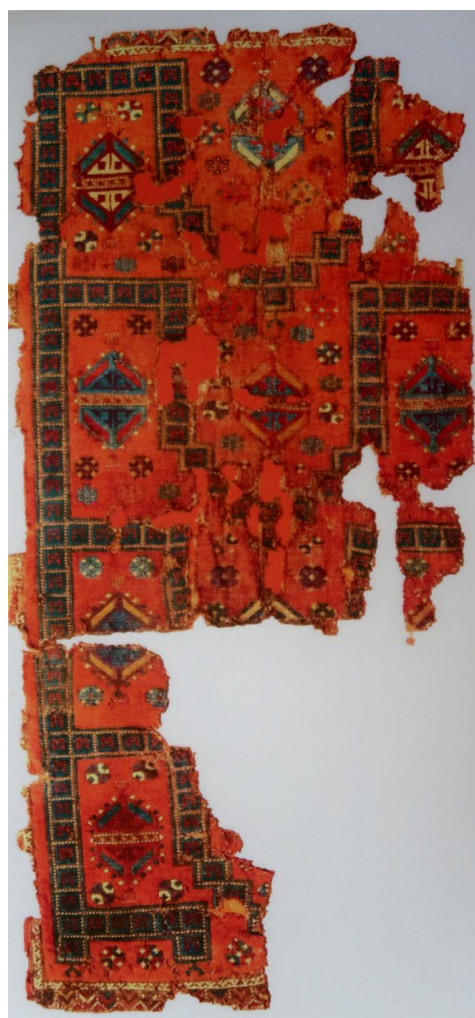
Tapis de Ladik de l'Anatolie centrale, en provenance de la mosquée Alaeddin, XIVe siècle, 82 x 169 cm