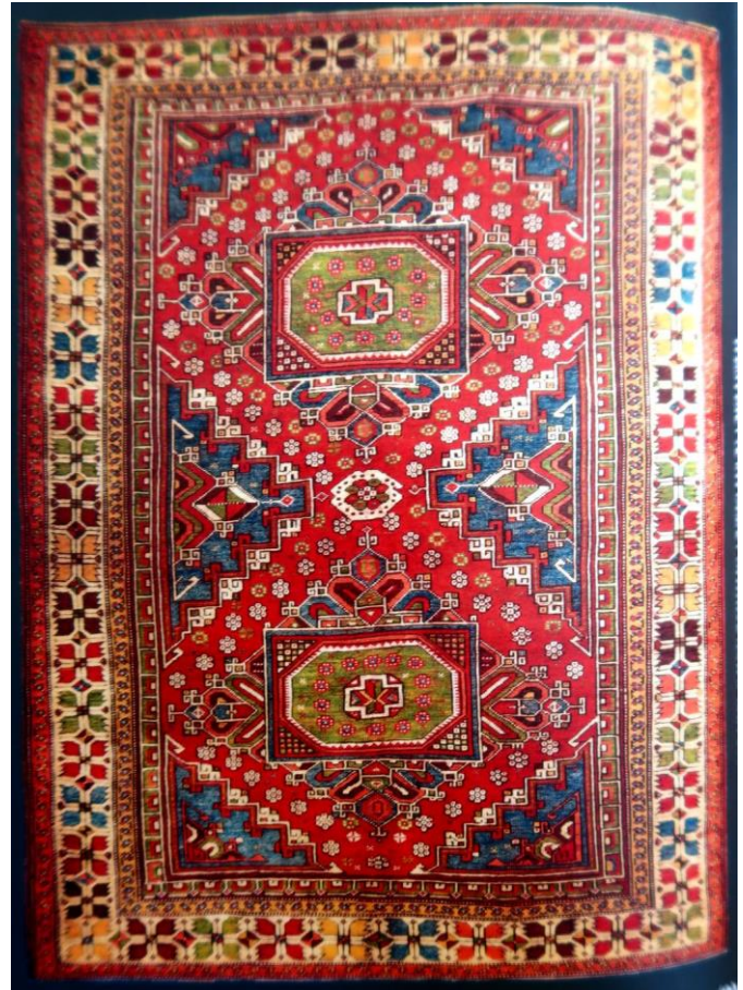
Tapis Sivas (Turquie) du début du XVIIe siècle 150 x 217 cm